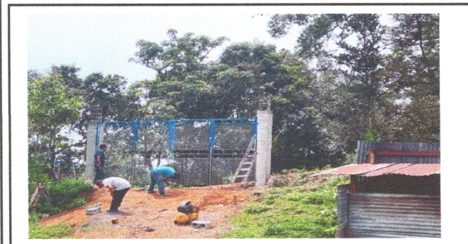
Foto: 5 MANTENIMIENTO A PORTONES