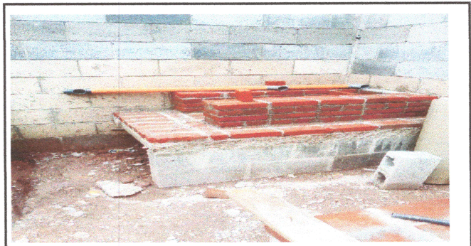
Foto4: SUSTITUCIÓN DE ORNILLA