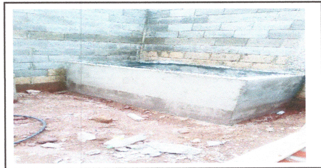
Foto: 6 SUSTITUCIÓN DE TANQUE DE AGUA

Observación: Si es necesario se pueden agregar hojas adicionales y actualizar el número de hojas.