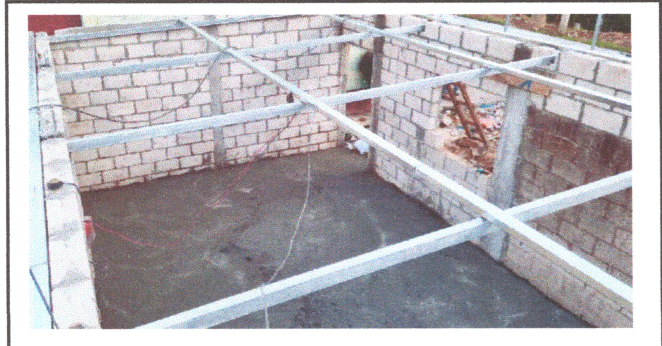
Foto1: SUSTITUCION DE CUBIERTA DE LAMINA