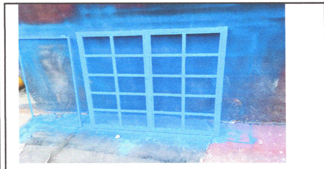
Foto3: SUSTITUCIÓN DE VENTANA