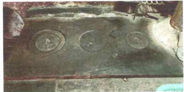
Foto4: REMODELACIÓN A ORNILLAS.