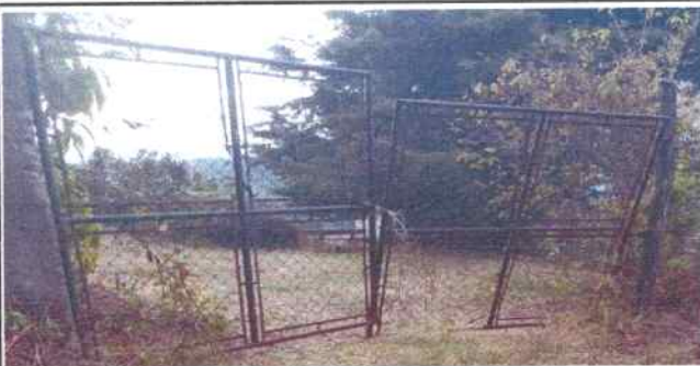
Foto: 5 MANTENIMIENTO DE PORTONES