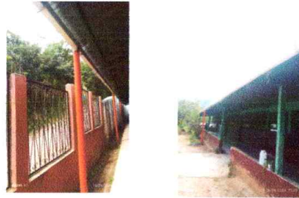
Foto 2: TRABAJO FINALIZADO DE REPARACION DE CANALES Y CAIDA DE AGUA PLUVIAL