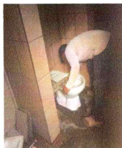
Foto 3: REPARACION DE SANITARIOS E INSTALACIÓN DE AGUA POTABLE EN 50%