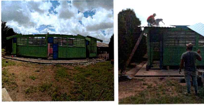
Foto1: Cubierta de lamina en proceso