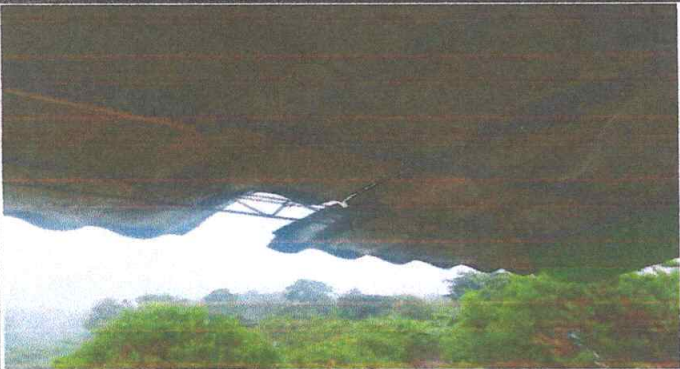
Foto1: TECHO DETERIORADO