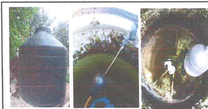
Foto: 5 DEPOSITO DE AGUA EN MAL ESTADO