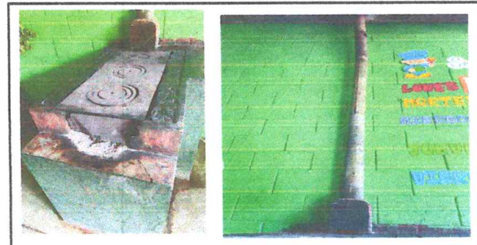
Foto: 6 COCINA EN DETEREORO

Observación: Si es necesario se pueden agregar hojas adicionales y actualizar el número de hojas.