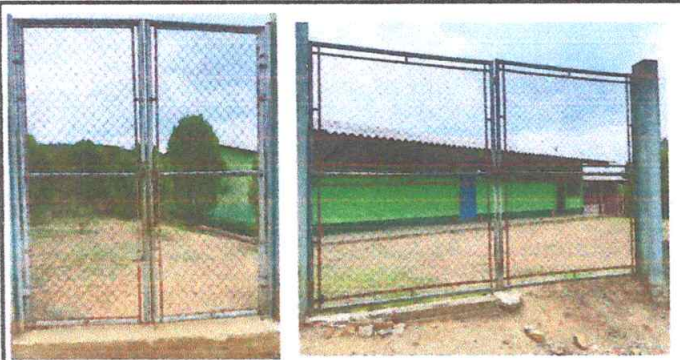
Foto3: PORTONES EN DETEREORO