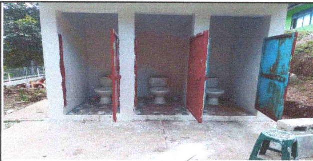
Foto 3: RENGLON No3, SERVICIOS SANITARIOS Y SUS ACCESORIOS, SE REALIZO EN SU TOTALIDAD.