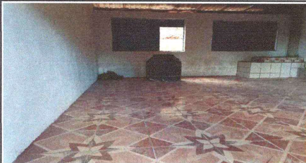
Foto 5: RENGLON No5, REPARACIÓN O SUSTITUCIÓN DE UNA CHAPALLALE Y REPARACIÓN DE ESTUFA RURAL. FINALIZADO EN SU TOTALIDAD.