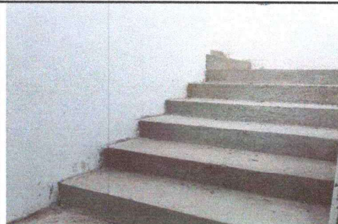
Foto 6: RENGLON No6, REPARACIÓN, SUSTITUCIÓN Y MANTENIMIENTO DE PAREDES EN COCINA, BAÑOS Y GRADAS, FINALIZADO EN SU TOTALIDAD.

Observación: Si es necesario se pueden agregar hojas adicionales y así mismo en el momento de las hojas.