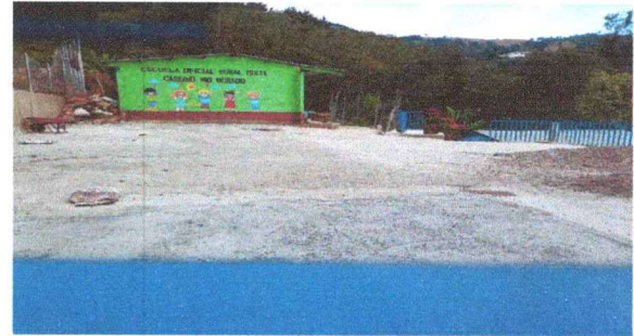
Foto 4: RENGLON No.4, SUSTITUCIÓN DE 260 M2 CUADRADOS DE LOSAS DE PATIO. SE REALIZO EN SU TOTALIDAD.