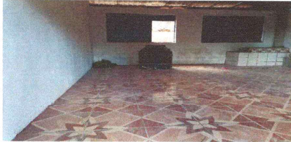
Foto 1: RENGLON No. 1 SUSTITUCIÓN DE PISO EN COSINA Y BAÑOS, SE REALIZO EN SU TOTALIDAD.