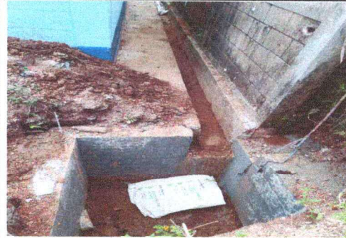
Foto 2: RENGLON No. 2 CUNETAS DE CONCRETO, SE REALIZO EN SU TOTALIDAD