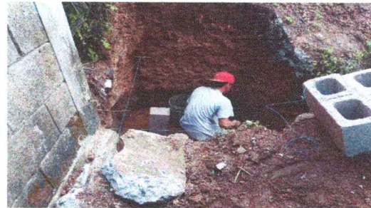
Foto 2: en esta fotografía se puede apreciar el avance de la cuneta de concreto y su caja de registro de salidas de aguas pluviales.