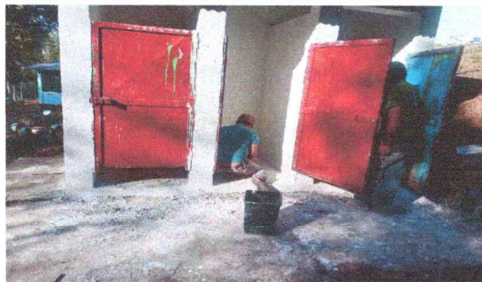
Foto 3: Según esta fotografías se puede apreciar el avance de los servicios sanitarios.