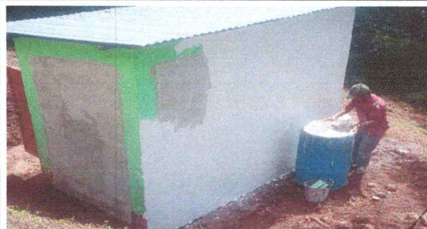
Foto 6: en esta fotografías se puede observar el avance de repello de paredes.

Observación: Si es necesario se pueden agregar hojas adicionales y actualizar el número de hojas.