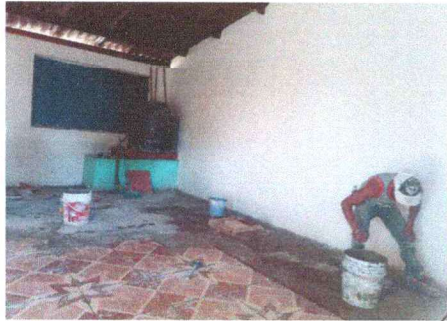
Foto1: En la presente fotografía se puede apreciar el avance de la sustitución de piso en cocina.