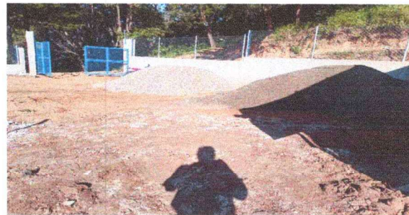
Foto 4: En esta fotografía se puede apreciar el avance de la sustitución de los 260 metros de losa de patio.