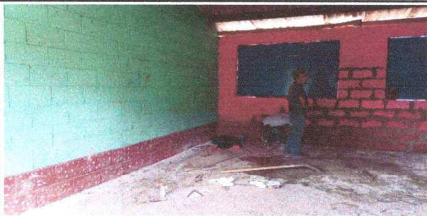
Foto 5: En esta fotografía se aprecia el avance de sustitución de area de cocina.