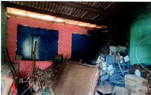
Foto 5: Reparación o sustitución de area de cocina (estufas rurales pilas, ventanas, puertas , chimeneas, etc. Se trabajará la cocina para brindarle un lugar adecuado a la alimentación de los niños y niñas del