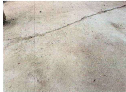
Foto 4 : Losa de Patio, se sustituirá la losa de patio para darle una mejor vista a la entrada del establecimiento.