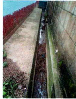
FFoto 2: Se aprecia la necesidad de reparación cuneta para ter una mejor salida de aguas pluviales.