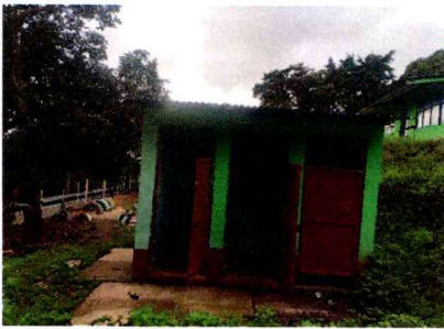
foto 3: Servicios sanitarios y sus accesorios, se sustituirán 3 sanitarios de la escuela para un mejor ambiente en el establecimiento.