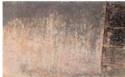
Foto 6: Reparación de repllo y cernido de paredes, se hará con el fin de que se vea un mejor ambiente en el area.

Observación: Si es necesario se pueden agregar hojas adicionales y actualizar el número de hojas.