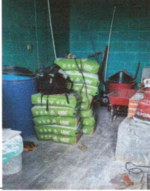
Foto1: Instalación de Piso