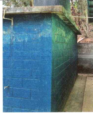
Foto 2: Se observa red de agua potable en los baños en mal estado