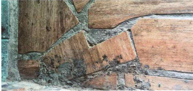
Foto1: Piso Deteriorado