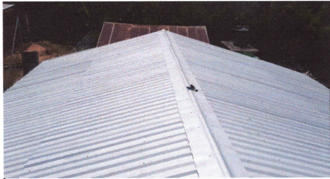
Foto1: CUBIERTA DE LAMINA FINALIZADA.