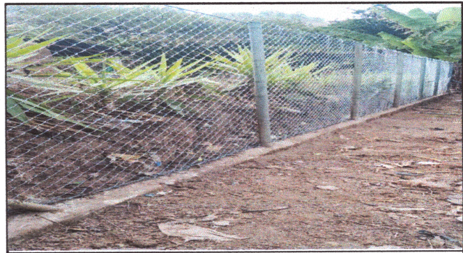
Foto4: SUSTITUCION DE CERCO O MURO PERIMETRAL.