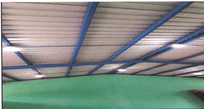
Foto: 5 REPARACION DE SISTEMA ELECTRICO.