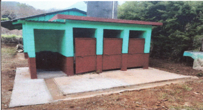
Foto3: MANTENIMIENTO A PUERTAS.