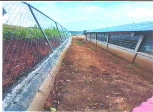
Foto 4: Cerco o muro Perimetral: Se evidencia el trabajo finalizado 100%