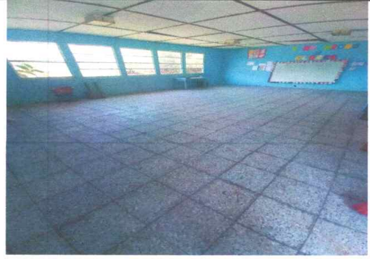
Foto 2: Piso: Finalización de colocación de piso en el aula 2 en 100%