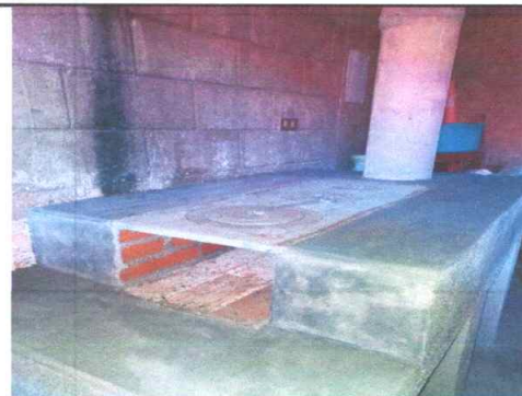
Foto 6: Reparación o Sustitución de Area de cocina: Se observa el trabajo finalizado en un 100%

Observación: Si es necesario se pueden agregar hojas adicionales y actualizar el número de hojas.