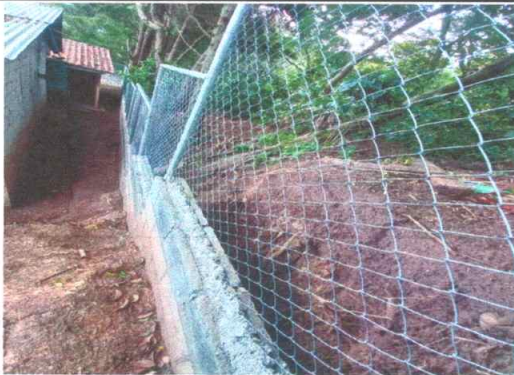
Foto 3: Cerco o Muro Perimetral: Finalización del trabajo en 100%