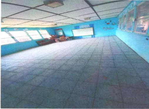
Foto1: Piso: Finalización de colocación de piso en un 100%