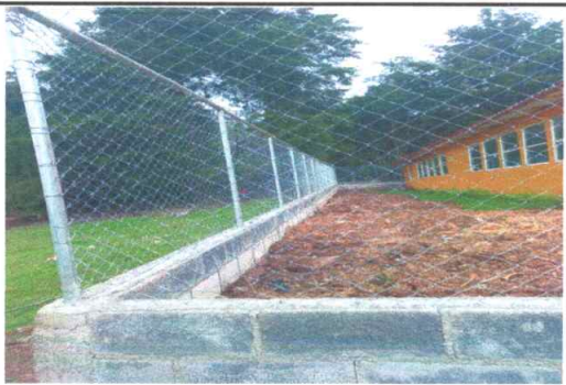
Foto 5: Cerco o muro Perimetral: Se evidencia el trabajo finalizado en 100%