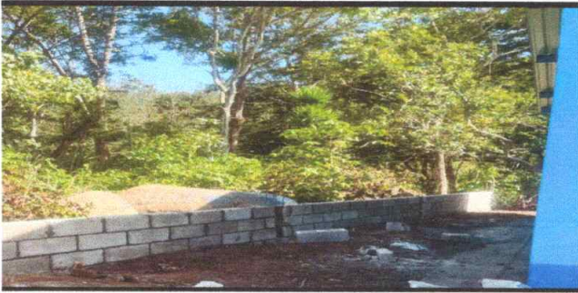
Foto1: cerco o muro perimetral (sustitución por mal estado de la malla y block quebrados)