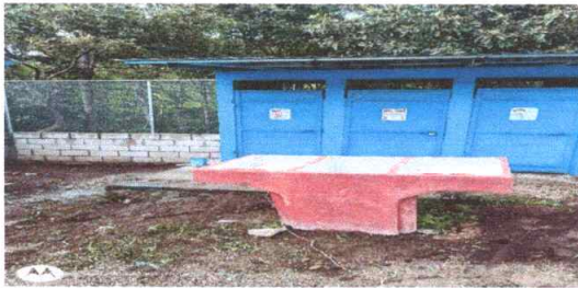
Foto 3: Reparación de área de cocina (sustitución de pila quebrada)