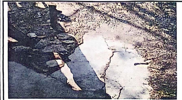
Foto1: QUITANDO LOSA ANTERIOR