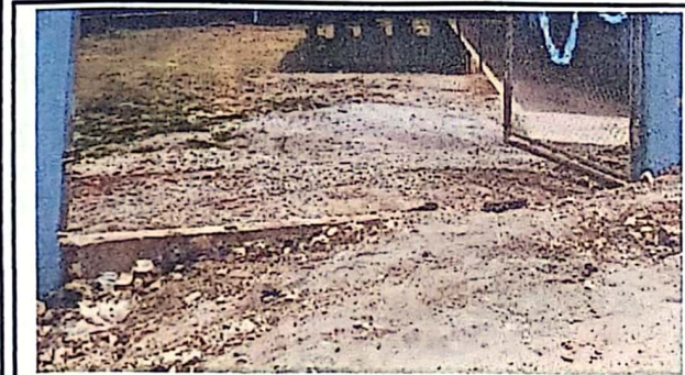
Foto3: SUELO NIVELADO Y PREPARADO PARA FUNDICION