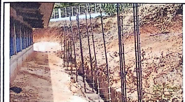
Foto: 5 FUNDICION DE ZAPATA Y COLUMNAS