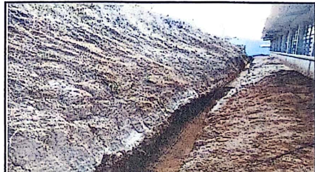
Foto4: ZANJEADO PARA ZAPATA Y COLUMNAS