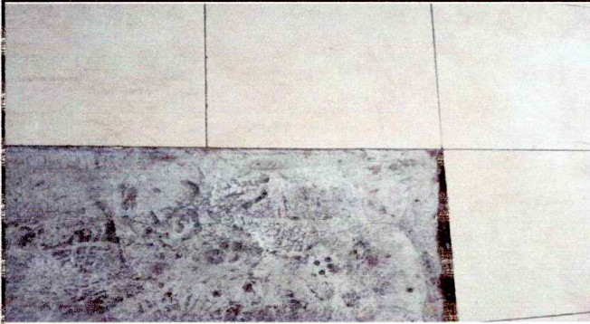
Foto1: Sustitución de piso