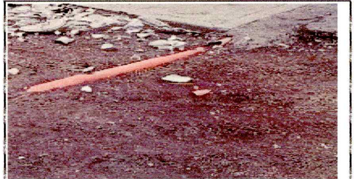
Foto: 6 REPARACION DE RED DE DRENAJES Y RED DE AGUA POTABLE

Observación: Si es necesario se pueden agregar hojas adicionales y actualizar el número de hojas.