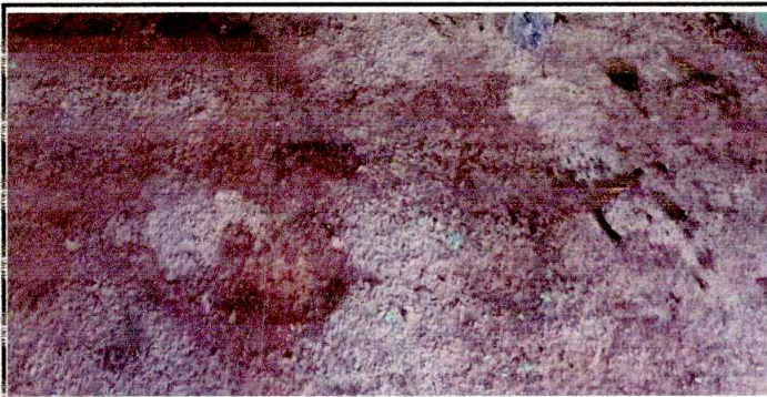
Foto3: SUSTITUCION DE LOSA DE PATIO