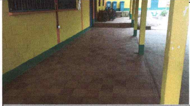
Foto 1: Sustitución de piso cerámico en área común de la escuela (corredores y aulas)