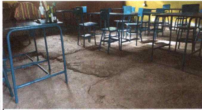
Foto 3: Reparación, nivelación y fundición de losa de patio en aula