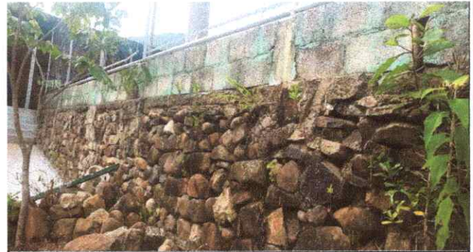
Foto 4: sustitución de repello tipo granceado en muro de contención de área común cancha deportiva.