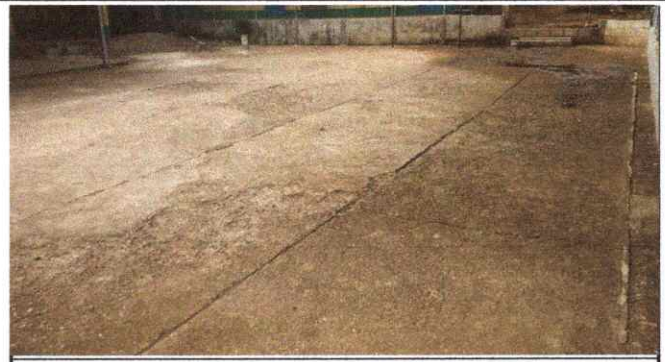
Foto 2: Fundición de losa de patio en cancha deportiva del centro educativo.