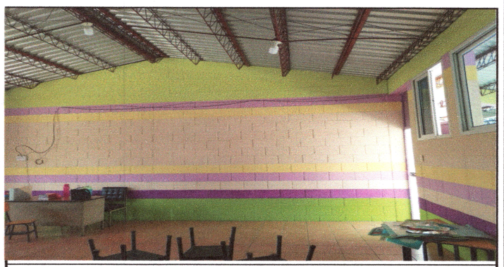
FOTO: SE REALIZO PINTURA EN MUROS INTERIOR Y EXTERIOR.

Observación: Si es necesario se pueden agregar hojas adicionales y actualizar el número de hojas.