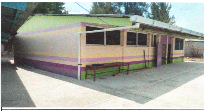
FOTO 5: SE REALIZO LA REPARACION DE CANALES Y BAJADAS DE AGUA PLUVIAL.