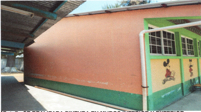
Foto7: SE REALIZARA PINTURA EN MUROS INTERIOR Y EXTERIOR