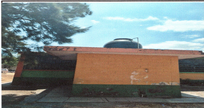
Foto9: SE REALIZARA REPARACION DE RED DE DRENAJE Y RED DE AGUA POTABLE.