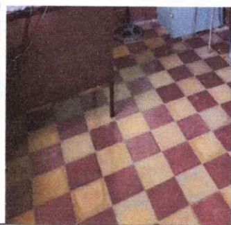
Foto1: SUSTITUCION DE PISO