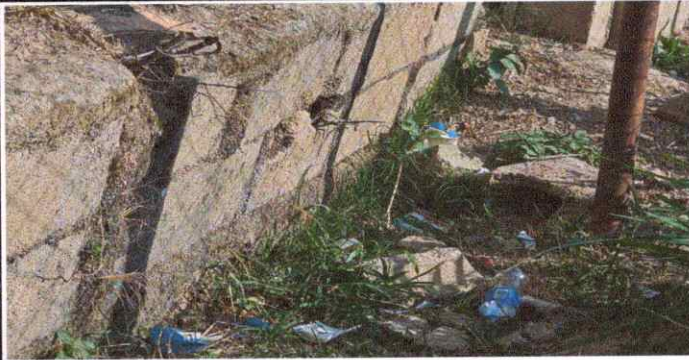
Foto1: SUSTITUCIÓN MURO PERIMETRAL BLOCK CISADO MAS COLUMNAS DE CONCRETO ESABIETADAS