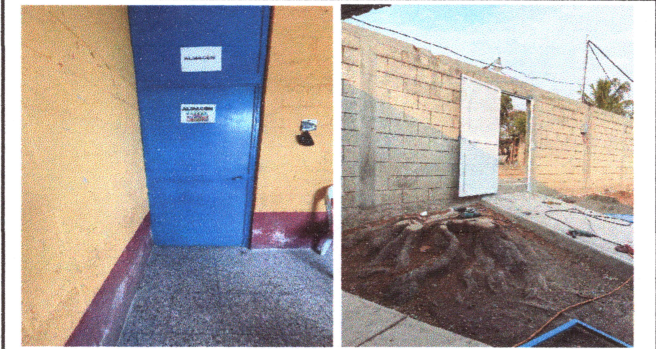
Foto3: Reparación y cambio de puertas.