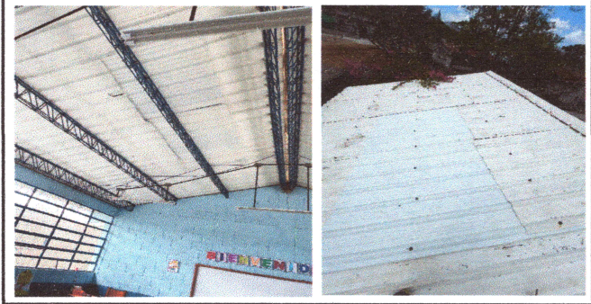
Foto: Láminas dañadas.