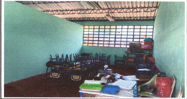
Foto1: Reparación de pared.