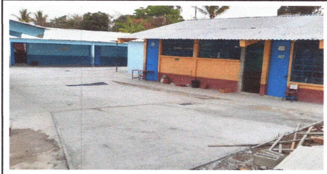
Foto4: Losa de patio.