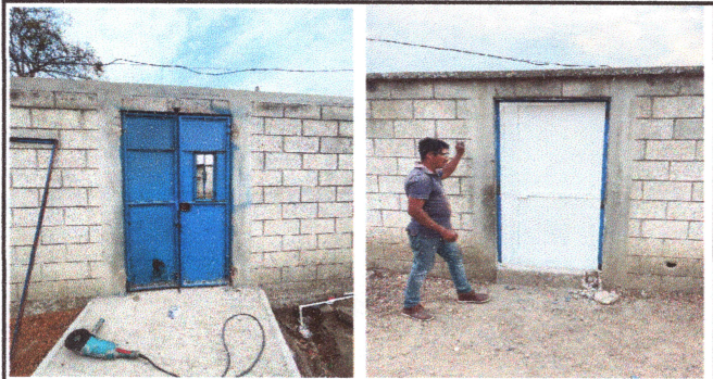
Foto3: Reparación y cambio de puertas.