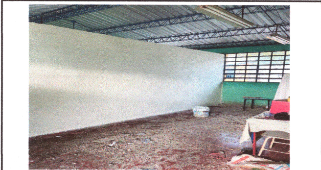
Foto1: Reparación de pared.