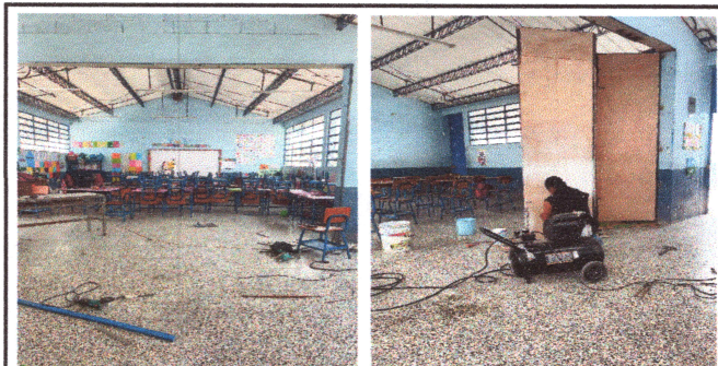
Foto: Reparación de puertas.

Observación: Si es necesario se pueden agregar hojas adicionales y actualizar el número de hojas.