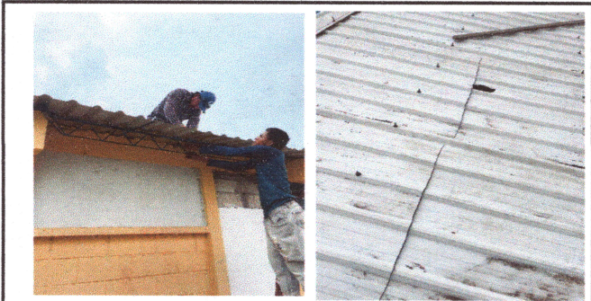
Foto: Láminas dañadas.