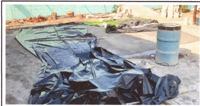
Foto4: Losa de patio.