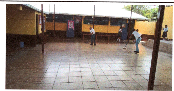
Foto: 6 TERMINADO CAMBIO DE CANAL DAÑADO

Observación: Si es necesario se pueden agregar hojas adicionales y actualizar el número de hojas.