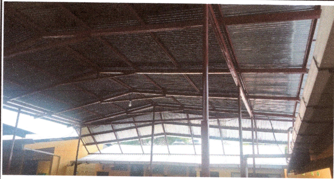
Foto1: TERMINADO EL LEVANTADO DE LA CUBIERTA DE TECHO MAS PINTURA