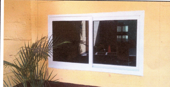
Foto4: CAMBIO DE VENTANAS TERMINADO