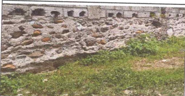
FOTO 4.2. SUSTITUCION MURO PERIMETRAL BLOCK CISADO MAS COLUMNAS DE CONCRETO.