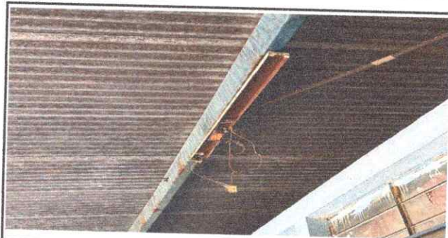
FOTO 5.1. SUSTITUCION DE LAMPARAS LED INCLUYE TUBO DUCTO, CABLE, INTERRUPTOR, ABRAZADERAS.

Observación: Si es necesario se pueden agregar hojas adicionales y actualizar el número de hojas.