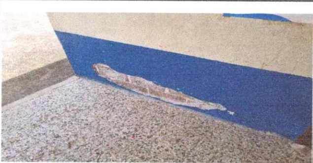
FOTO 6.1. SUSTITUCION DE REPELLO Y CERNIDO.