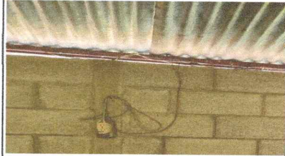
FOTO 5.3. SUSITUCION DE CABLEADO CALIBRE 12 MAS DUCTO PVC SOBREPUESTO