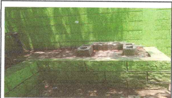
FOTO 7.1. REPARACION O SUSTITUCION DE AREA DE COCINA ( ESTUFA RURALES, PILA, VENTANA, PUERTAS, CHIMENEA.)