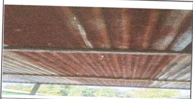
FOTO 2.1. SUSTITUCION ESTRUCTURA DE TECHO.