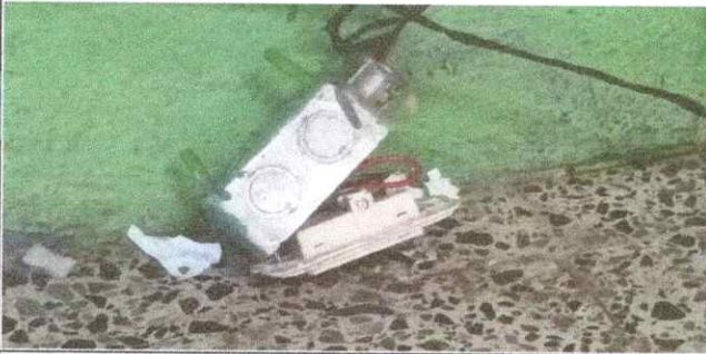
FOTO 5.2. SUSTITUCION DE TOMACORRIENTE.