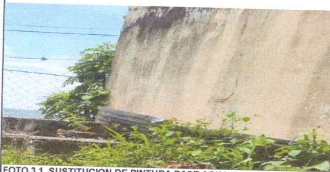
FOTO 3.1. SUSTITUCION DE PINTURA BASE AGUA.