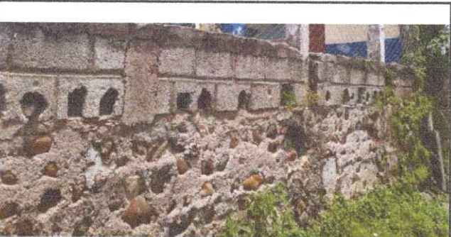
FOTO 8.1. SUSTITUCION MURO DE CONCRETO CICLOPEO.