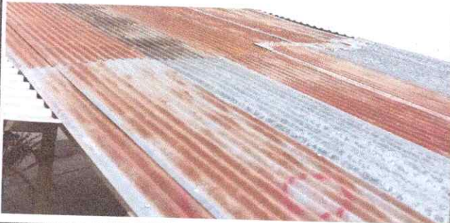
FOTO 1.1. SE SUSTITUCION LAMINA TROQUELADA.