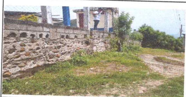
FOTO 4.1. SUSTITUCION DE CERCO PERIMETRAL CON BLOCK Y MALLA.