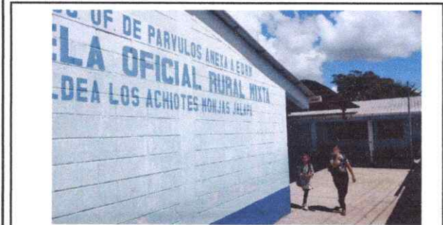
Foto 5: La Escuela se encuentra ubicada en el centro de la comunidad, a la izquierda del cruce hacia el Caserío Buena Vista.