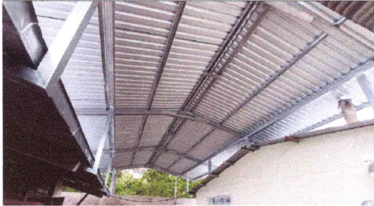
Foto1: CUBIERTA INSTALADA