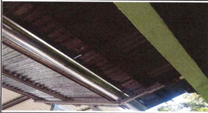
Foto1: SUSTITUCIÓN DE LAMINA TROQUELADA CALIBRE 26