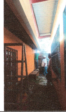
Foto 2: Se hizo cambio de canal ya que el que estaba anteriormente no era el indicado.