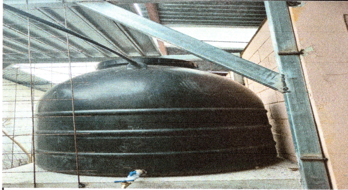
FOTO 6: SE REALIZO REPARACION Y MANTENIMIENTO DE CISTERNA/DEPOSITO DE AGUA POTABLE.