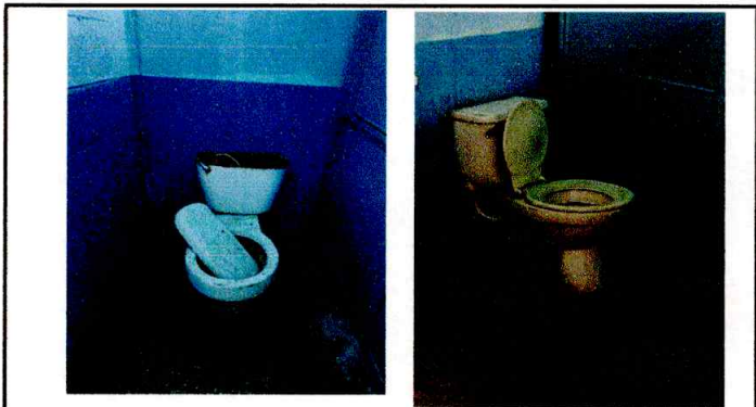
Foto4: Sustitución de tazas sanitarias.