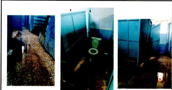
Foto1: Reparacion de red de drenaje agua pluvial baños.