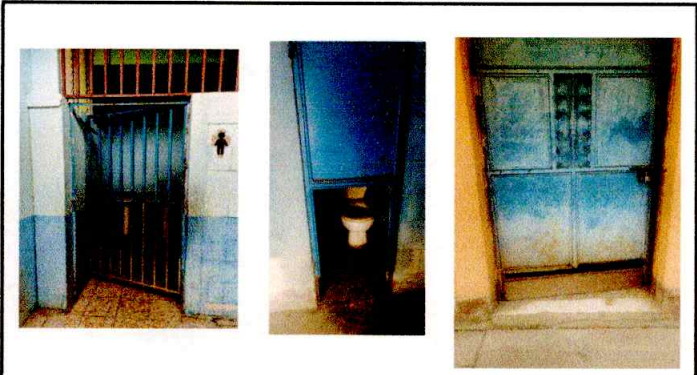
Foto3: Mantenimiento de puertas de baños.