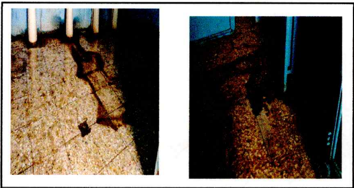
Foto: 6 Reposición de piso

Observación: Si es necesario se pueden agregar hojas adicionales y actualizar el número de hojas.