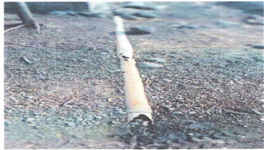
Foto 2: ES NECESARIO LA SUSTITUCION COMPLETA A LA RED HASTA LA FOSA.