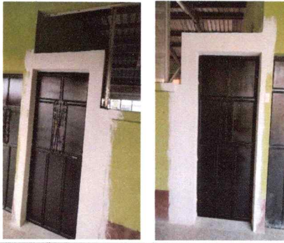
Foto1: Puertas (sustitución, de cocina y aula)