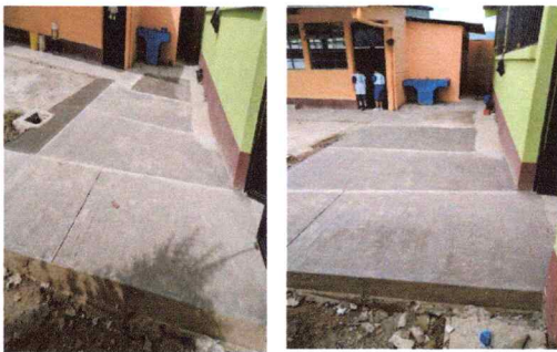
Foto3: Reparación de red de drenaje y red de agua potable (sustitución)