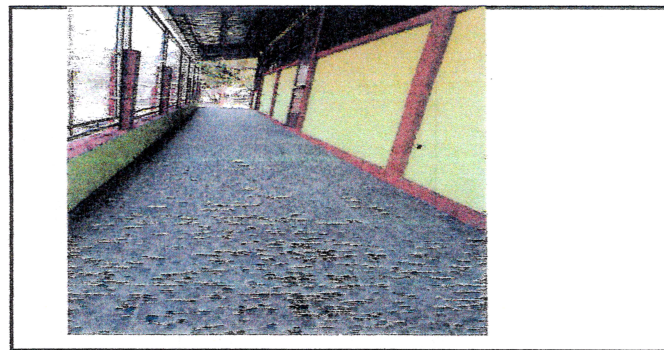
FOTO:6 Instalacion de piso de corredor

Observación: Si es necesario se pueden agregar hojas adicionales y actualizar el número de hojas.