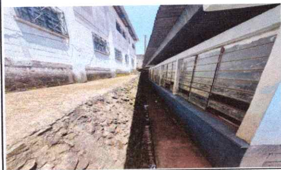
FOTO 3.1: REPARACION Y MANTENIMIENTO DE VENTANA PINTURA, CICLOPEO, LIMPIEZA DE VIDRIOS.