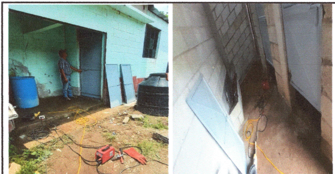
FOTO 5 : COLOCACION Y PINTURA DE PUERTAS DE LOS BAÑOS AULAS Y PORTON