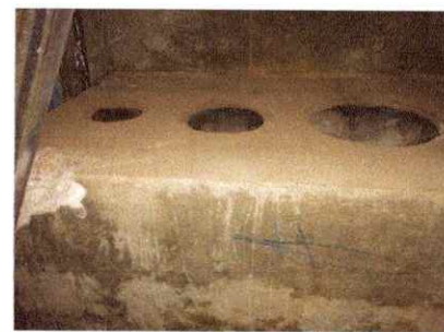
Foto 6: reparación o sustitución de área de cocina, azulejo, tubo de chimenea y sombrero de chimenea

Observación: Si es necesario se pueden agregar hojas adicionales y actualizar el número de hojas.