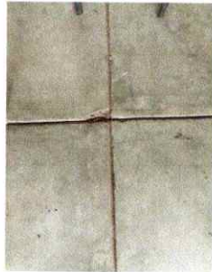
Foto1: reparación de piso