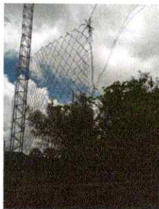
Foto 9: sustitución de (malla y tubo de metal; alambre garbanizado)