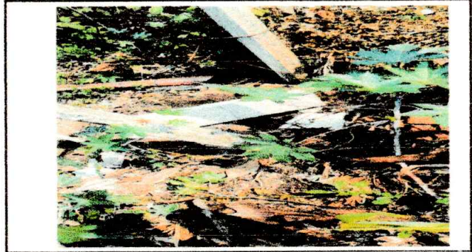
FOTO NO 2: SE OBSERVA CERCO O MURO PERIMETRAL Y COLUMNAS DERRIBADAS.