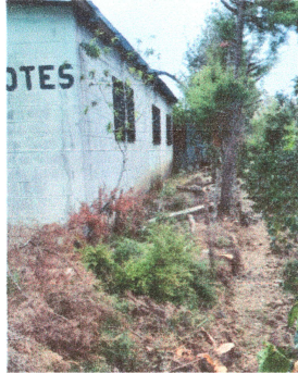
Foto1: Cercos de muro.