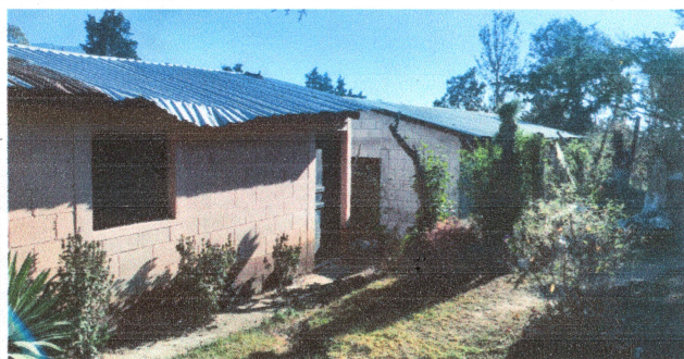
Foto1: Cubierta de Lamina.