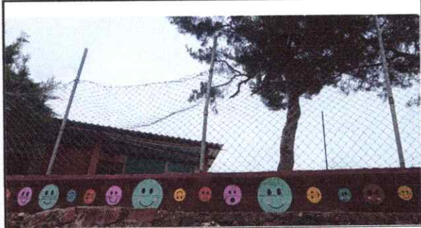
Foto 1.1: SE CONSTRUIRA UN MURO DE BLOCK DE 1 METRO DE ALTO QUE LLEVARA ZAPATAS, COLUMNAS, VIGAS INTERMEDIAS Y VIGA DE REMATE Y TENDRA UNA LONGITUD DE 35 METROS LINEALES Y DE