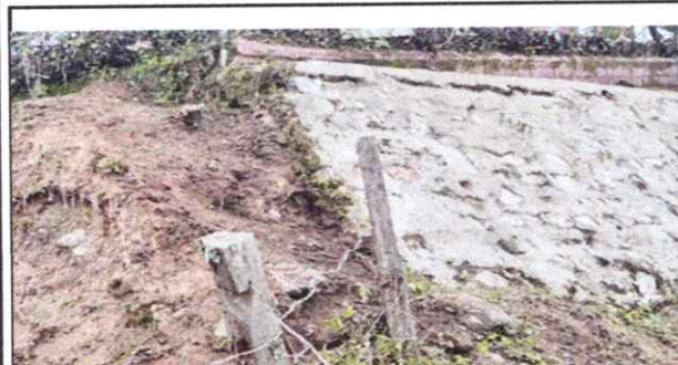
Foto 2: CONSTRUCCION DE UN MURO CICLOPEO DE MEDIDAS DE 6 DE LARGO Y ALTO 5 METROS