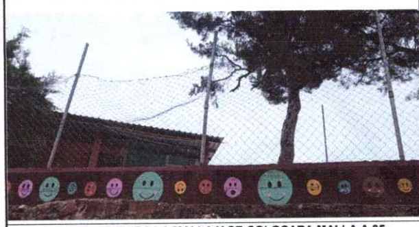
Foto 1.2: SE SUSTITUIRA LA MALLA Y SE COLOCARA MALLA A 35 METROS LINEALES CON UNA ALTURA DE 1 METRO DE MALLA CON TUBO DE 2 PULGADAS.