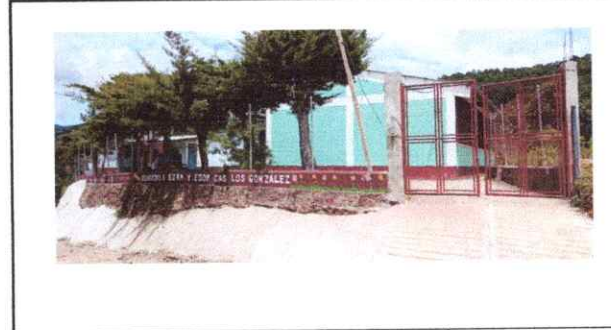
Foto 3: CENTRO EDUCATIVO EODP Y EORM CASERIO LOS GONZALEZ LA CAÑADA, SAN CARLOS ALZATATE, JALAPA.