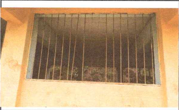
FOTO 3.3: REPARACION Y MANTENIMIENTO DE VENTAS PINTURAS CILICON, LIMPIEZA.