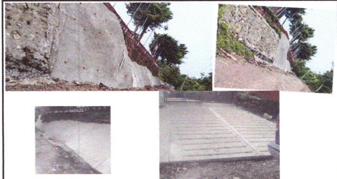
Foto 10: REBESTIMIENTO DE CONCRETO EN TALUD CON ELECTROMALLA Y ENSABIETADO A LA SUPERFICIE DEL TERRENO NATURAL.