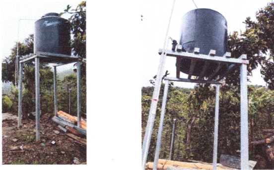
Foto 7: MANTENIMIENTO DE TINACO MEDIANTE NUEVO KIT DE ACCESORIOS PARA VOLVERLO A QUE SEA FUNCIONAL