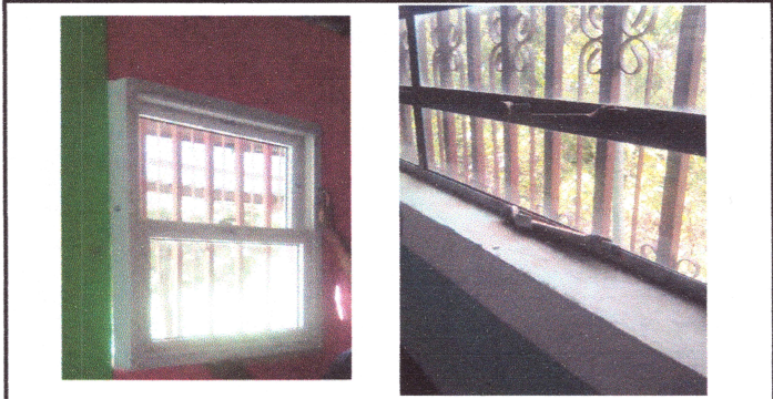
Foto 1: INSTALACION DE UNA VENTANA DE PVC Y PUESTA DE DOS VIDRIOS DE LA VENTARIA PERSIANA DE METAL.