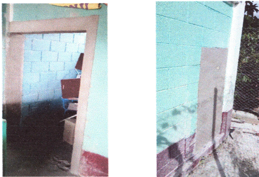
Foto 9: FUNDICION DE COLUMNA, MOCHETA Y TALLADO DE MARCOS DE PUERTA Y AREAS EXTERIORES.