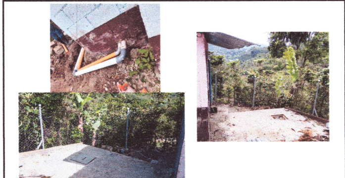
Foto 4: PARA EL CORRECTO FUNCIONAMIENTO DE LOS DOS SANITARIOS NUEVOS ES NECESARIO LA INSTALACION DE UN NUEVO SISTEMA DE DRENAJE YA QUE EL ACTUAL SON BAÑOS SEPTICOS.