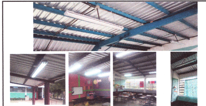
Foto 6: REPARACION DE SISTEMA DE ILUMINACION DUCTOS Y CABLEADOS Y LAMPARAS

Observación: Si es necesario se pueden agregar hojas adicionales y actualizar el número de hojas.