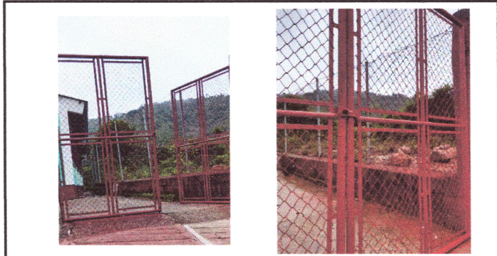
Foto 3: SE LE DARA MANTENIMIENTO AL PORTON DE INGRESO MEDIANTE PINTURA ANTICORROSIVA.