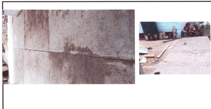
Foto 5: FUNDIR 38.4 METROS CUADRADOS DE LOSA DE PATIO CON UN ESPESOR DE 8 CM, TALLADOS.