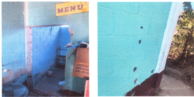
Foto 9: FUNDICION DE COLUMNA, MOCHETA Y TALLADO DE MARCOS DE PUERTA Y AREAS EXTERIORES.