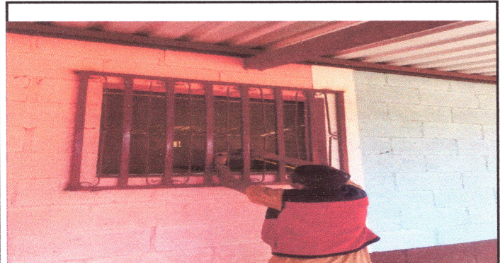
Foto 1: INSTALACION DE UNA VENTANA DE PVC Y PUESTA DE DOS VIDRIOS DE LA VENTARIA PERSIANA DE METAL.