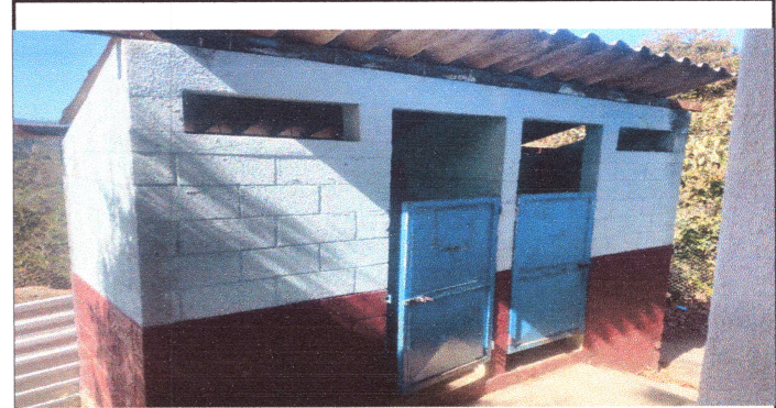
Foto 4: PARA EL CORRECTO FUNCIONAMIENTO DE LOS DOS SANITARIOS NUEVOS ES NECESARIO LA INSTALACION DE UN NUEVO SISTEMA DE DRENAJE YA QUE EL ACTUAL SON BAÑOS SEPTICOS.