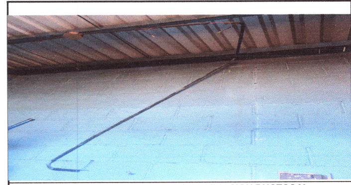
Foto 6: REPARACION DE SISTEMA DE ILUMINACION DUCTOS Y CABLEADOS Y LAMPARAS

Observación: Si es necesario se pueden agregar hojas adicionales y actualizar el número de hojas