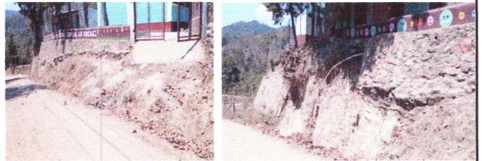
Foto 10: REBESTIMIENTO DE CONCRETO EN TALUD CON ELECTROMALLA Y ENSABIETADO A LA SUPERFICIE DEL TERRENO NATURAL.

Observación: Si es necesario se pueden agregar hojas adicionales y actualizar el número de hojas.