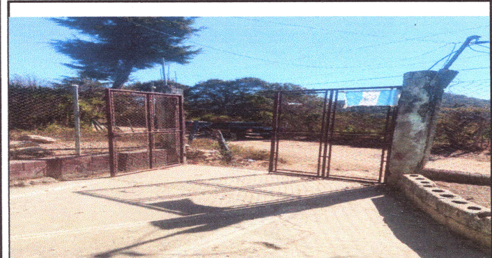
Foto 3: SE LE DARA MANTENIMIENTO AL PORTON DE INGRESO MEDIANTE PINTURA ANTICORROSIVA.