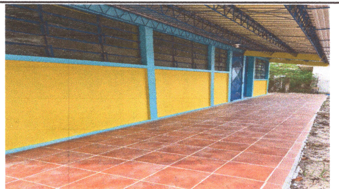
Foto4: pintura exterior, piso corredor