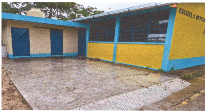
Foto1: loza de patio, ventanas, puertas y pintura exterior