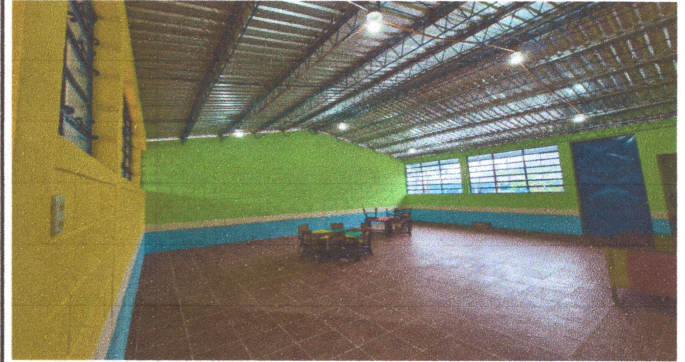
FOTO 2: energia electrica, piso interior aula, pintura interior, techo y estructura