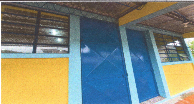
Foto3: puertas reparadas y ventanas