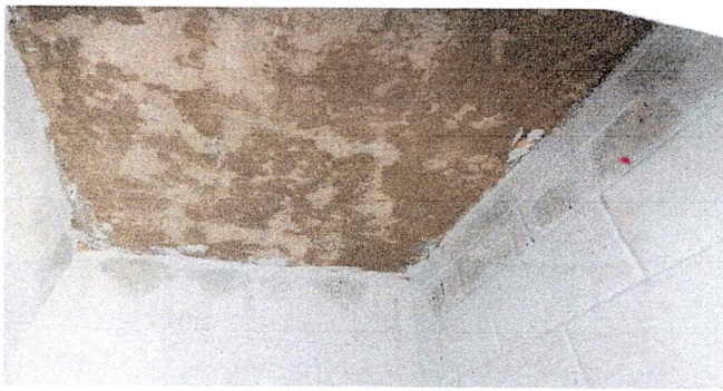
Foto1: Losa de techo de sanitarios en mal estado, por filtración de agua.