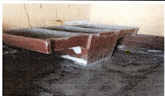
Foto: 6 Pila en mal estado con grietas y fuga de agua.

Observación: Si es necesario se pueden agregar hojas adicionales y actualizar el número de hojas.