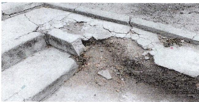
Foto: 5 Losa de patio con grietas y quebraduras.