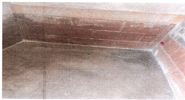
Foto3: Pintura deteriorada de interior y exterior.