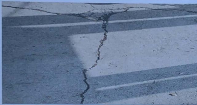
Foto3: Losa de patio en cocina con grietas y quebraduras.