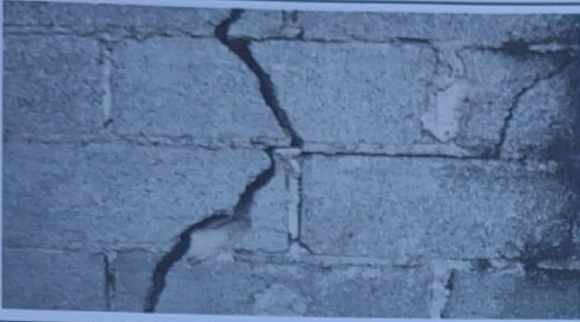
Foto1: Paredes en malas condiciones, peligro de caer por deterioro.