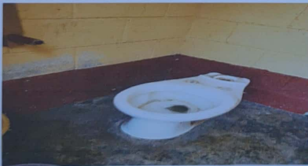
Foto: 5 Sanitarios deteriorados.