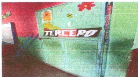
Foto 10: Puertas de aulas dañadas brindando inseguridad a la población estudiantil.