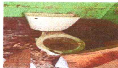
Foto 4: Baños en malas estado por lo que no pueden usarse por la población estudiantil.