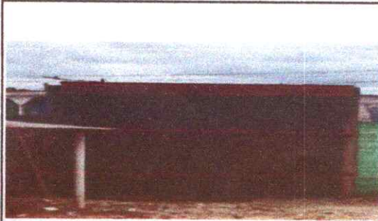
Foto 1: Porton en mal estado, poniendo en riesgo la seguridad de los alumnos y el resguardo del establecimiento.