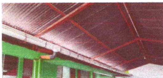
Foto 8: Canal en malas condiciones probocando escape de agua durante las lluvias en el salon del centro educativo