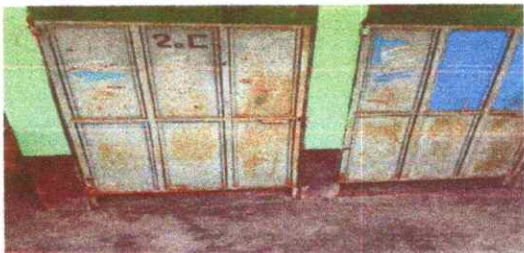
Foto 7: Puertas de baños dañadas probocando así exponer a los estudiantes al usar los baños