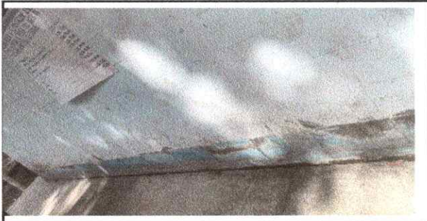
Foto 5: SUSTITUCIÓN DE PINTURA A BASE DE AGUA, BASE DE ACEITE (ZÓCALO)