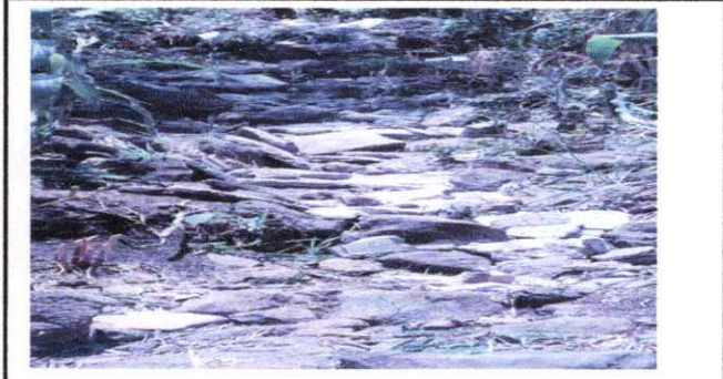
Foto7: SUSTITUCION DE CUNETETA DE CONCRETO