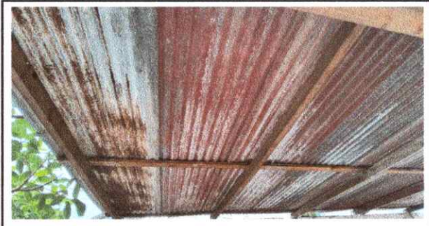
Foto1: SUSTITUCIÓN DE LAMINA TROQUELADA CALIBRE 26