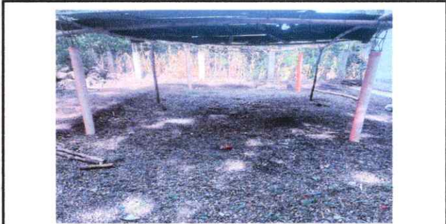
FOTO 11: SUSTITUCION DE COLUMNAS AREA DE COCINA (ESTUDA RURALES, PILAS, VENTANAS, PUERTAS, CHIMENEAS, ETC.)