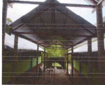
Foto 1: CUBIERTA DE LAMINA (SUSTITUCION LAMINA TROQUELADA CALIBRE 26)